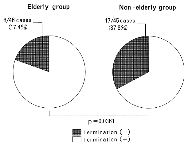
Fig. 1 Success rate of intravenous disopyramide treatment for the termination of atrial fibrillation

LVDd = left ventricular diastolic dimension; LAD = left atrial dimension; LVEF = left ventricular ejection fraction; HANP = human atrial natriuretic peptide; SNR = sinus nodal rhythm.