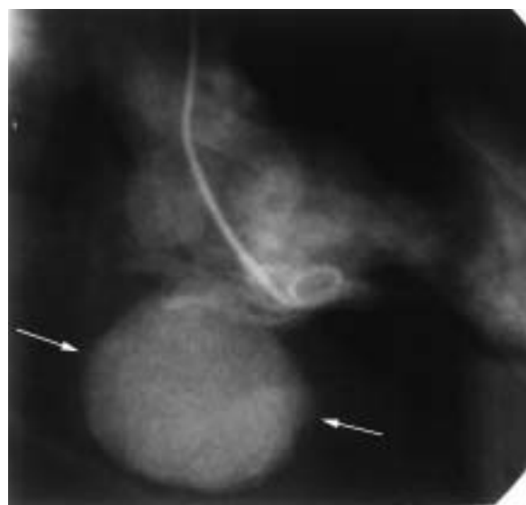
Fig. 2 Left ventriculogram showing a large and round ventricular aneurysm (arrows) in the posterior wall

染などが挙げられる 1-3) 。仮性瘤の形成される部位は、左室後壁、側壁、前壁などさまざまで、とくに好発部位はない。感染由来のものでは起炎菌は黄色ブドウ球菌が多く 3-5) 、本症例でも、起炎菌は黄色ブドウ球菌であった。