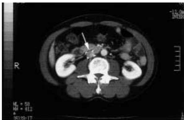
Fig. 2 Computed tomography scan with contrast medium in the venous phase on March 18, 2004, showing thrombus trapped in the vena cava filter (arrow)

の経過観察を推奨する報告が多い 1,3) 。リンパ腫の形成自体、リンパ流のうっ滞を表しており、これだけでも会陰部および下肢の浮腫を呈する原因となるが、頻度は少ないものの、本例のようにリンパ腫が静脈を圧迫することにより、深部静脈血栓症や肺血栓塞栓症を発症した症例も報告されている 4) 。Brawerら 5) は前立腺癌術後に生じた巨大なリンパ腫に急性肺血栓塞栓症を合併した症例を報告している。また、Heinzerら 6) は前立腺全摘除術後、頻回に超音波検査を行い、リンパ腫を早期に発見し、20ml以上のリンパ腫に対しては無症状でも積極的に経皮経管的ドレナージ治療を行う方針で治療したことにより、術後の深部静脈血栓症が4.7%から1.6%へ、肺血栓塞栓症は1.6%から0.5%へ減少したと報告している。通常、リンパ腫は自然消退することと、ドレナージ治療に伴う感染や腸管損傷などの合併症を考慮すると、このような治療方針が妥当かどうかは議論が必要であるが、リンパ腫が深部静脈血栓症や肺血栓塞栓症の原因として重要であることを示す報告であり、注目される。本例では静脈内に明らかな血栓形成が認められ、リンパ腫のドレナージにより外腸骨静脈への圧排を急速に解除すると、肺血栓塞栓症を発症する可能性が高いと考えられたため、下大静脈フィルターの留置を優先した。血栓溶解療法や抗凝固療法による血栓の移動と出血性合併症を考慮し、フィルター留置後にワルファリンのみの投薬を開始した。