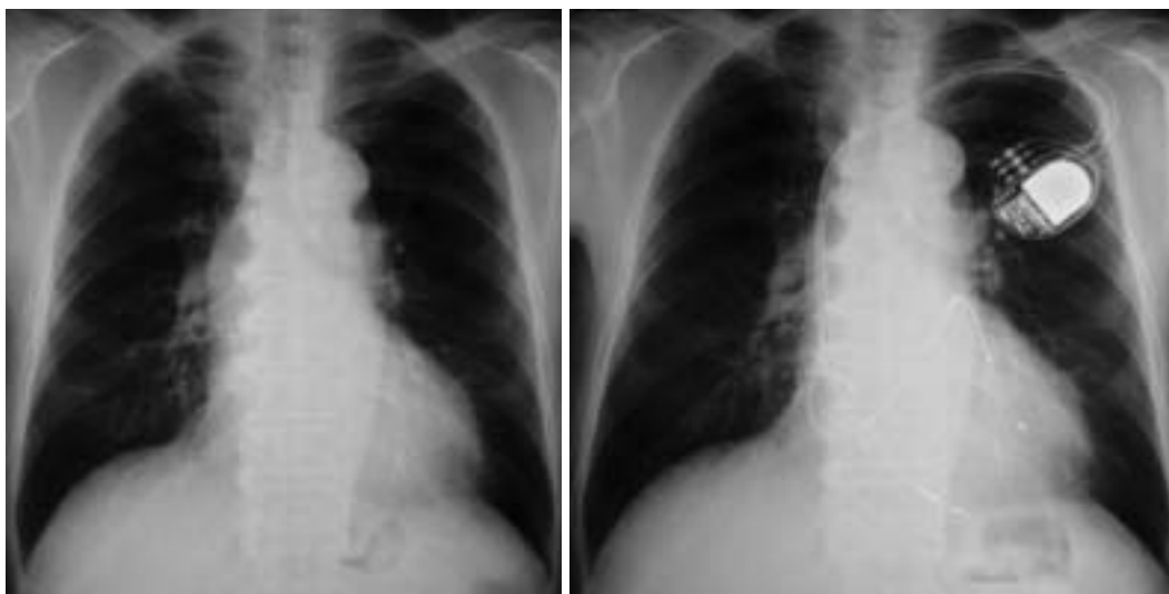
Fig. 1 Chest radiographs before( left )and after( right )biventricular pacemaker implantation Cardiothoracic ratio was 52% before biventricular pacing therapy( left )and 48.3% after therapy( right )